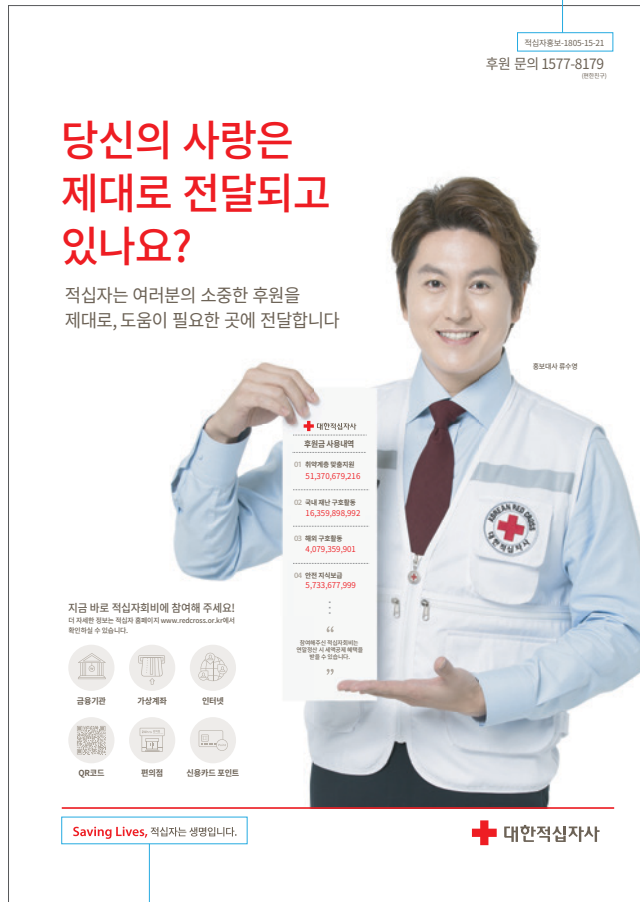
Saving Line 사용 시 슬로건 위치